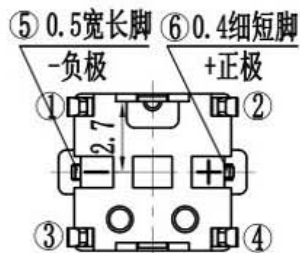
轻触开关主要技术指标: Main Specifications: